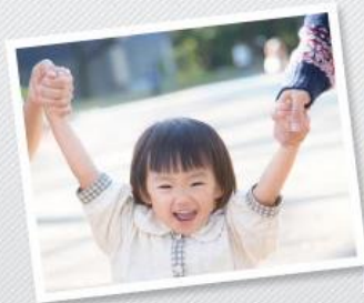
お子様をお育てのご家族