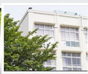
富山大学の学生さん、職員の方など