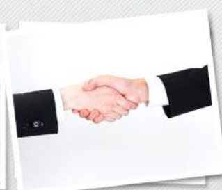
法人契約のご利用も承ります