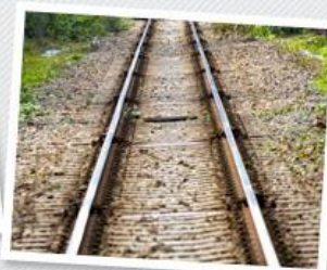
公共交通での通勤を望まれる方